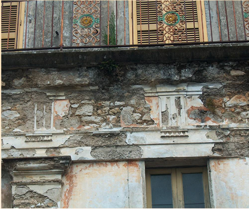
STATO DI CONSERVAZIONE DELLE SUPERFICI DI FACCIATA